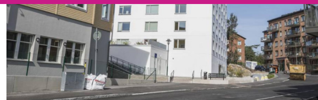
Det behövs fler studentbostäder